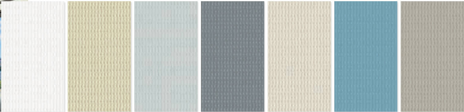
Gestellfarbe WT 029/70786 | Dessin Pergona transluzent PE 10 (Weiß)