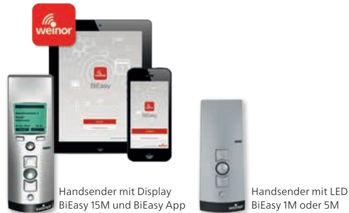
Handsender mit Display BiEasy 15M und BiEasy App

Mit der Infrarot-Heizung Tempura können Sie Ihre Terrasse abends länger nutzen – auch in kühleren Jahreszeiten. Sie bringt angenehme Sofortwärme ganz ohne Vorheizen. Tempura ist dimmbar, energieeffizient und leicht zu bedienen.